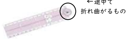
分度器機能付き定規(×)